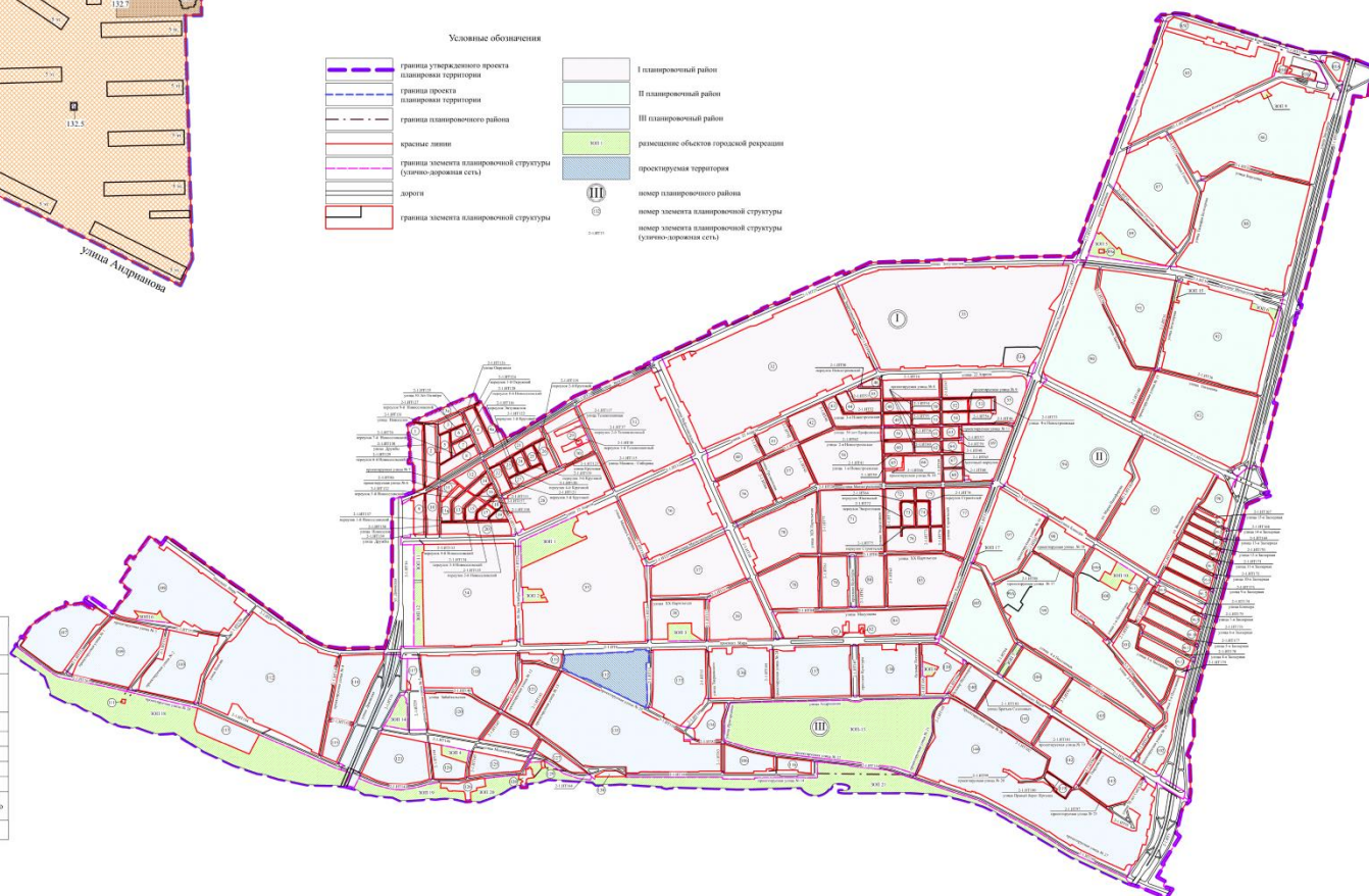
Схема расположения границ проектирования и элементов планировочной структуры проекта планировки территории городка Нефтяников, расположенной в границах: правый берег реки Иртыш – улица Заозерная – улица Комбинатская – улица Химиков – улица Энтузиастов – переулок 1-й Окружной – переулок 2-й Окружной – улица Доковская – проспект Мира – северо-восточная граница отвода «Сибэкстрострой», АТП-10, ГСК «Асфальт» – в Советском административном округе города Омска

Примечание: 1. Разработчик: бюджетное учреждение города Омска «Омскградостроитель». 2. Заказчик: департамент архитектуры и градостроительства Администрации города Омска. 3. Проект планировки территории разработан по топографической схеме масштаба 1:500.